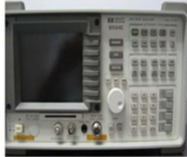
HP 8594E 频谱分析仪