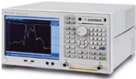
安捷伦 E5071C 网络分析仪